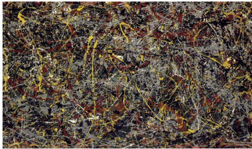
No: 5, Jackson Pollock (1912 -1958)