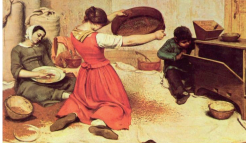
Buğday Toplayıcılar, Gustave Courbet (1819-1877)